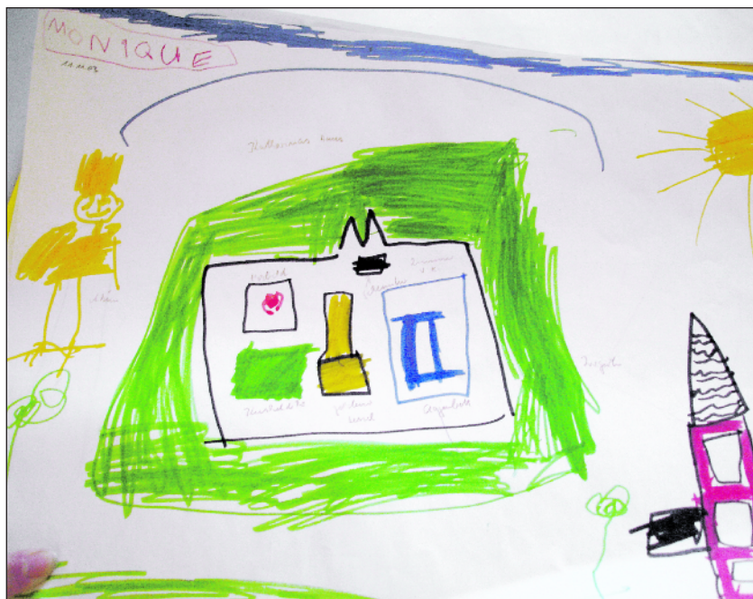
Ein Bild von Monique Parduzi.