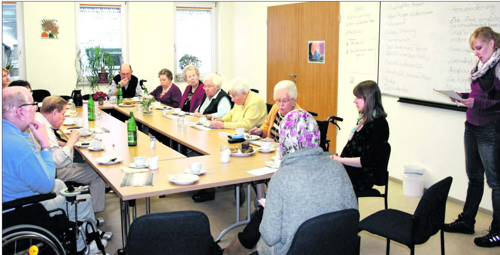
Gemeinsam philosophieren im Seniorenzentrum St. Martin in Essen.

Uni aktiv – Service Learning im Bereich soziale Arbeit bringt Studierende der Uni Duisburg-Essen und Senioren zusammen