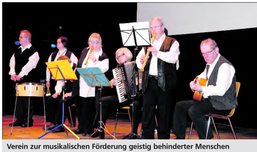
Verein zur musikalischen Förderung geistig behinderter Menschen