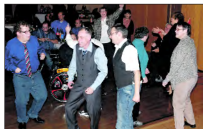
Unsere Gäste hatten auch ihren Auftritt.