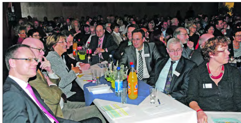
Vorstand mit Gästen