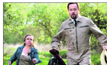
ChrisTine Urspruch und Jan Josef Liefers als „Alberich“ und Professor Boerne

ziert wird. Mit Schlagfertigkeit und Charme bietet ChrisTine Urspruch als „Alberich“, wie ihr Chef sie nach dem Nibelungen-Zwerg nennt, dem immer leicht arroganten Experten Paroli.