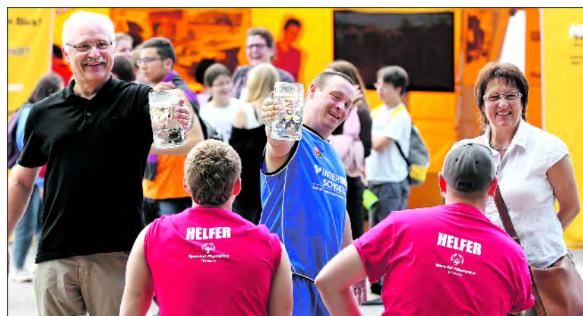
Helfer im Einsatz bei den Special Olympics 2012 in München

Inhaber Utto Reugels, der das Unternehmen 1978 gegründet hat: „Menschen mit Behinderung werden in verschiedenen Bereichen eingesetzt und können so ihre Fähigkeiten auf dem ersten Arbeitsmarkt entfalten.“ vw