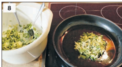
2 EL von der Kartoffelmasse in die Pfanne geben, etwas andrücken.

Aus: Kochwerkstatt des Familienunterstützenden Dienstes der Lebenshilfe Heinsberg in Leichter Sprache