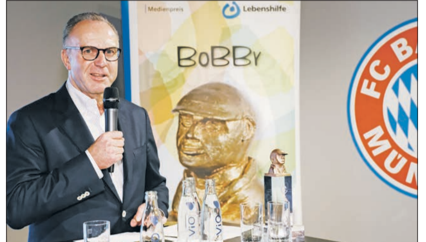
Karl-Heinz Rummenigge bei der BOBBY-Verleihung

... an einen jungen Mann mit Behinderung, der auf den Rollstuhl angewiesen ist. Ich kenne ihn jetzt schon einige Jahre, wir treffen uns immer wieder, und so unterschiedlich unsere Leben sind – in der Leidenschaft für den Fuß-