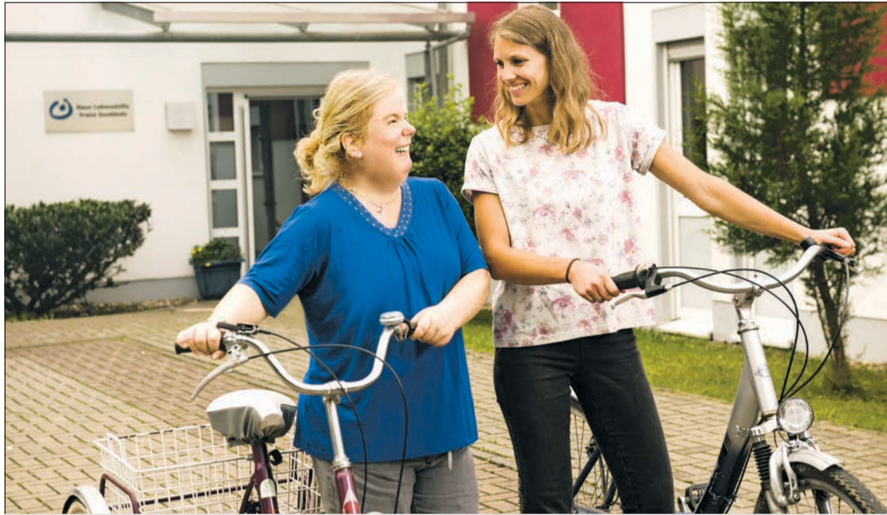
Gemeinsam und füreinander im Einsatz im Rahmen des Tandem-FSJ.

Das Freiwillige Soziale Jahr für Menschen mit und ohne Behinderung