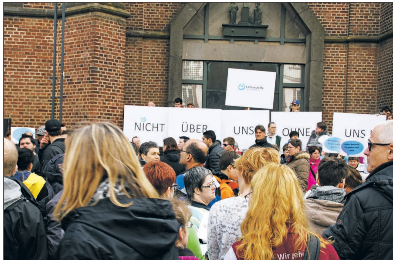
Demo der Lebenshilfe Rhein-Kreis Neuss auf dem Grevembroicher Marktplatz

Demo der Lebenshilfe Rhein-Kreis Neuss e.V. und anderer Lebenshilfen