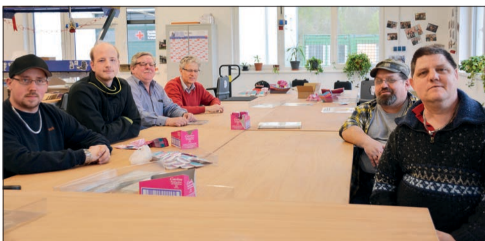
Im neuen Berufsbildungszentrum sind Lernen und Arbeiten in hellen, modernen Räumen möglich.

35 Männer und Frauen mit einer psychischen Erkrankung werden dort auf ihr Berufsleben vorbereitet. 27 Monate dauert die Aus-