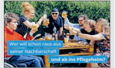
Wer will schon raus aus seiner Nachbarschaft und ab ins Pflegeheim?

Verlust des Zuhauses? Neue Kampagne der Lebenshilfe soll auf kritische Punkte des Bundesteilhabegesetzes aufmerksam machen