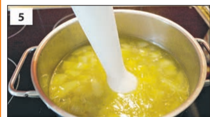
Nach dem Kochen mit einem Pürierstab pürieren.

Aus: Kochwerkstatt des Familienunterstützenden Dienstes der Lebenshilfe Heinsberg in Leichter Sprache