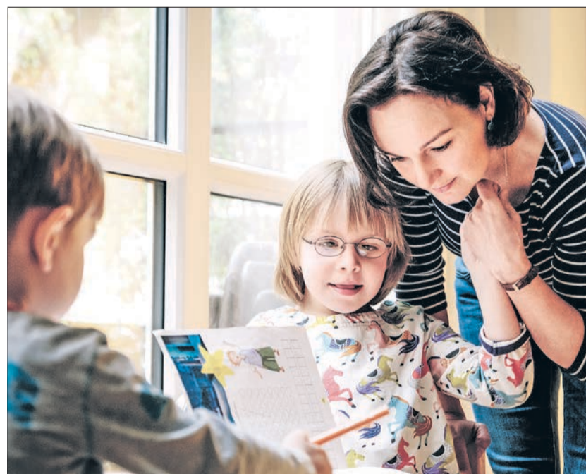
Auf besondere Bedürfnisse und Möglichkeiten der Kinder angemessen reagieren.

„Eine Kita für alle“ benötigt nach Auffassung der Lebenshilfe NRW