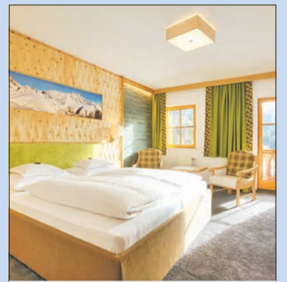
Vital- und Wanderhotel Taurerwirt

Testcenters in Matri. Der Gutschein hat einen Wert von etwa 500 Euro und ist auch während der Woche einlösbar, da die Wanderungen im Hotel von Montag bis Freitag stattfinden.