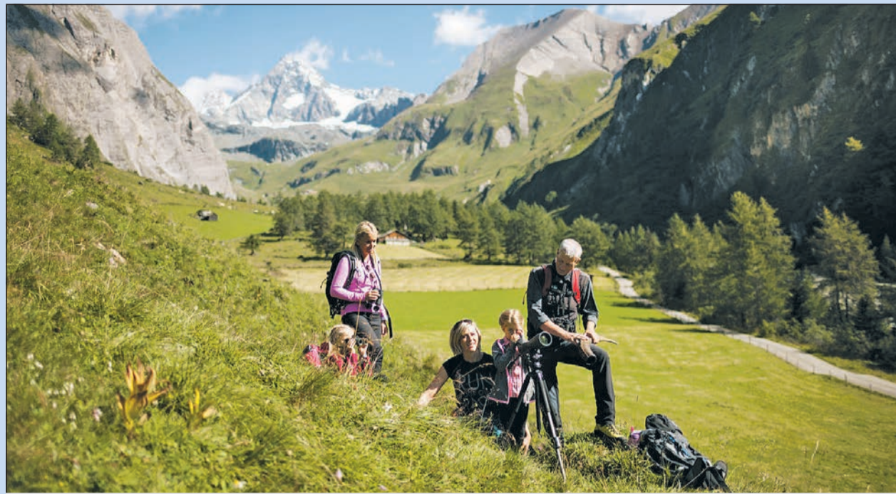
Fernab der Alltagshektik: Wandererlebnis Großglockner in Osttirol