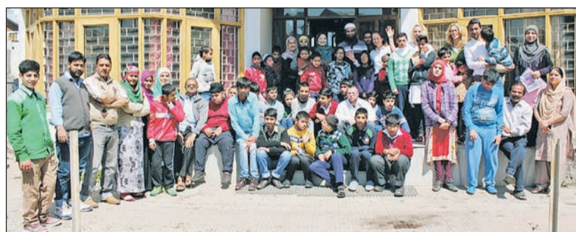
Eine große Familie: Kinder und Angestellte mit den Besuchern aus Deutschland in Srinagar