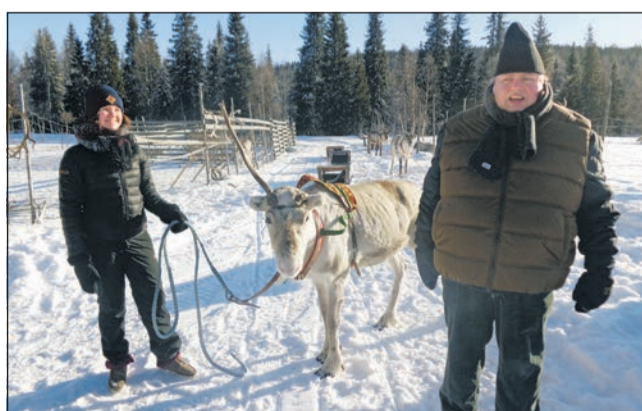
Die Lebenshilfe Waltrop kann den nächsten Winter mit einem Paar Schneeschuhen genießen.