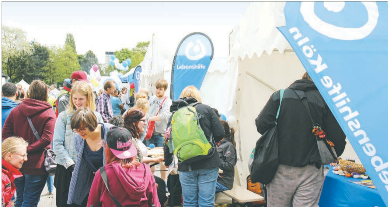
Die Lebenshilfe-Meile auf dem Tag der Begegnung war gut besucht.