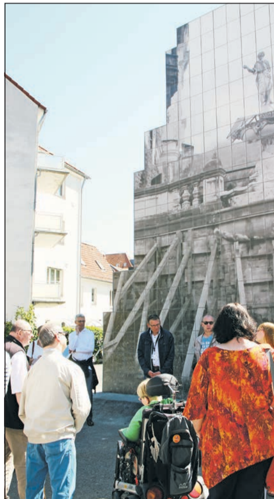
Miteinander ins Gespräch kommen und die Langsamkeit entdecken: die Gruppe vor der Skulptur „Peles Empire“

Mit allen Sinnen Skulpturen erfahren. Geht das? „Bei einem Gemälde wäre das nicht möglich. Unsere Führungen ermutigen zum Anfassen“, sagt Frank Tafertshofer, Leiter der LWL Presse- und Öffentlichkeitsarbeit. Der Landschaftsverband Westfalen Lippe (LWL) bietet im Rahmen der Ausstellung Projekte 2017, die seit 1977 im zehnjährigen Rhythmus Künstler aus aller Welt einlädt, ihre Werke in der Stadt entstehen zu lassen, in Münster kostengünstige Rundgänge für Menschen mit Behinderung an. Vier verschiedene Touren richten sich bis zum 1. Oktober insbesondere an Gruppen von Menschen mit geistiger, Geh-, Hör- und Sehbehinderung.