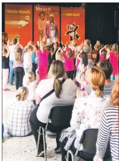
Gut gefüllter Saal

standen. Unser Elternbeirat half bei den Vorbereitungen und am Tag selber mit, was wir sehr zu schätzen wissen. Auch mit dabei waren beim Konzert die ehrenamtlichen Helfer des Deutschen Roten Kreuzes des Ortsverbandes Linnich und auch ehrenamtliche Vertreter der Feuerwehr. Wir möchten uns bei allen Helfern von ganzem Herzen bedanken. Es war schön, zu erleben, dass es so viele engagierte Menschen gibt.