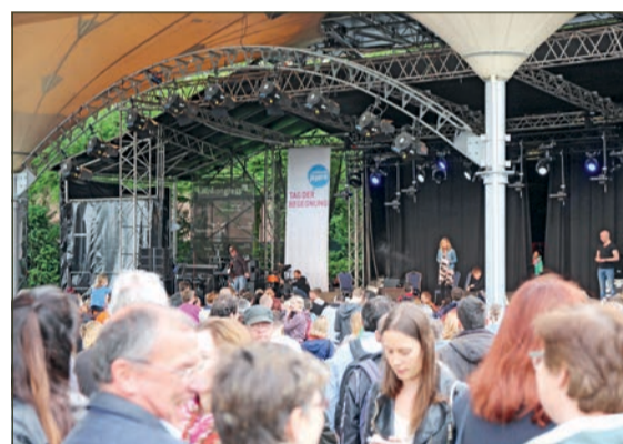
Tolle Auftritte auf der Tanzbrunnenbühne