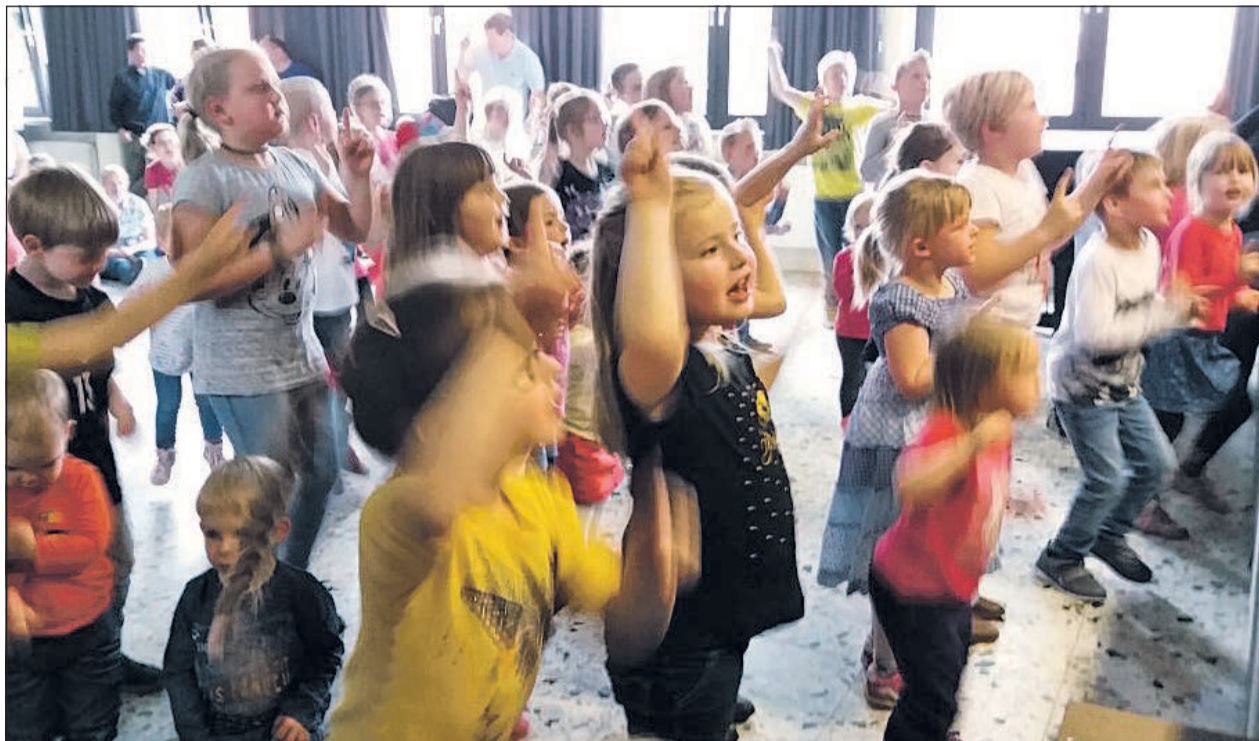
Die Kinder singen begeistert mit.

Eine gute Stunde lang zog er vor allem die Kinder in seinen Bann. Abwechselnd zwischen flotten, langsamen und neuen sowie bekannten Liedern wie „Das singende Känguru“ oder „Kika Tanzalarm“, schaffte er es, alle Altersklassen zu begeistern. Für kleine Pausen in seinem Programm sorgte Volker Rosin, indem er einzelne Kinder zu sich auf die Bühne holte und gemeinsam mit ihnen und den Zuschauern ruhigere Lieder anstimmte. Nach weiteren Zugaben und der Mög-