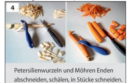
Petersilienwurzeln und Möhren Enden abschneiden, schälen, in Stücke schneiden.

Aus: Kochwerkstatt des Familienunterstützenden Dienstes der Lebenshilfe Heinsberg in Leichter Sprache