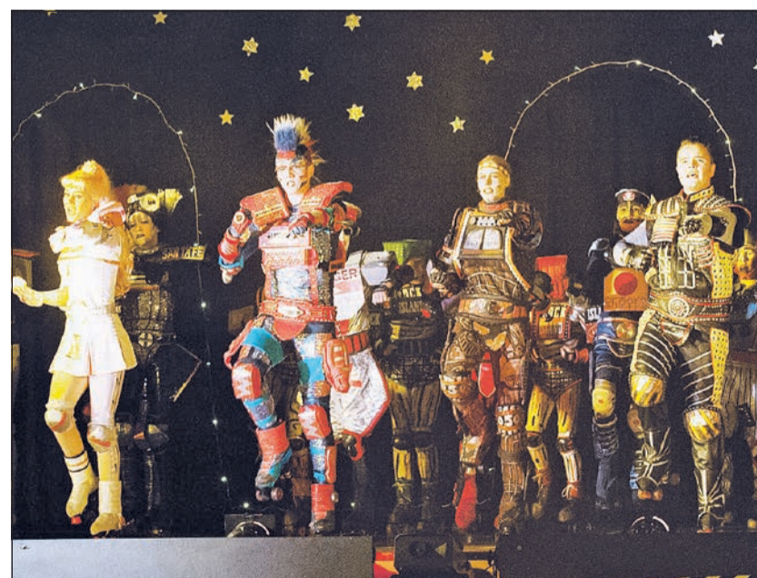
Sternenlicht-Revue: Hauptrollen des Musicals (von links): Pearl, Electra, Rusty und Greaseball