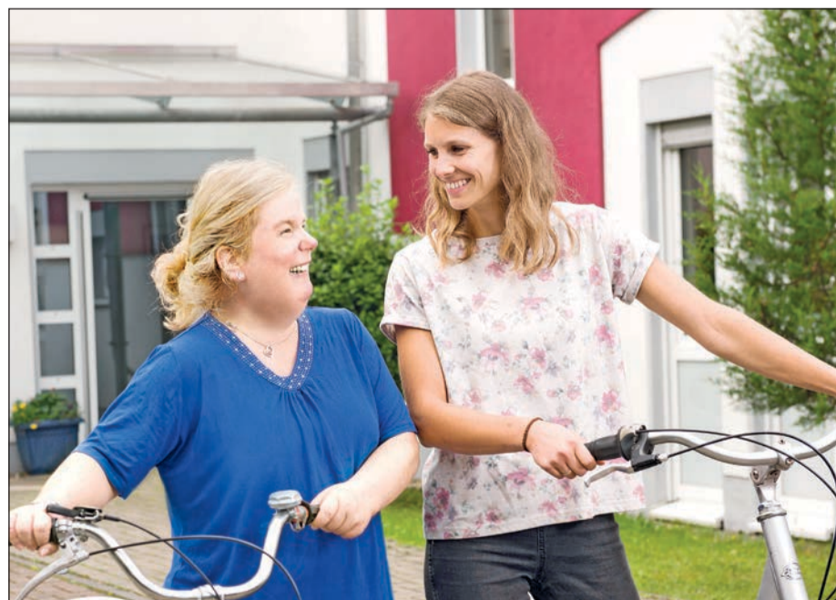
Gemeinsam und füreinander im Einsatz im Rahmen des FSJ-Tandems.

„Wenn die Stärken junger Menschen im sozialen Bereich liegen