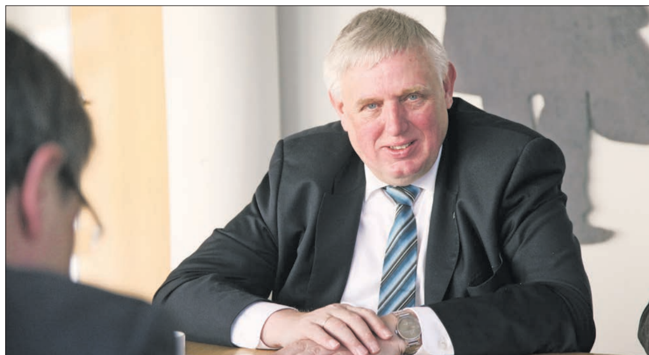
NRW-Landesminister Karl-Josef Laumann zur besseren Integration von Menschen mit Behinderung in die Gesellschaft

D rei Fragen – drei Antworten: Karl-Josef Laumann, Minister für Arbeit, Gesundheit und Soziales des Landes Nordrhein-Westfalen, stellte auf Anfrage des Lebenshilfe journals schriftlich dar, wie Menschen mit Behinderung noch besser in die Gesellschaft integriert werden können.