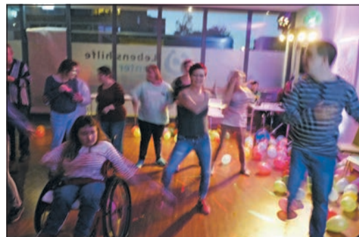
Die Stimmung war ausgelassen

D üren. Laute Disco-Musik tönt aus den Boxen, bunte Scheinwerfer und Luftballons sorgen für Partystimmung. Tanzen, feiern, fröhlich sein, sich mit Freunden austauschen gehören zu den Grundbedürfnissen vieler Menschen – körperliche und geistige Beeinträchtigungen spielen dabei keine Rolle.