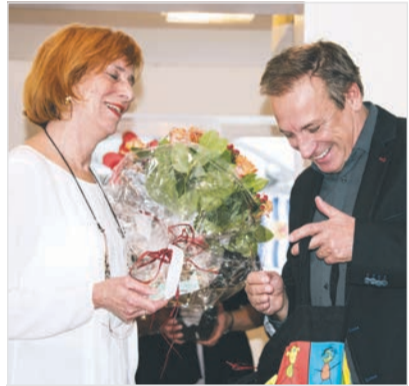
Wie man sieht, bereiten kleine Abschiedsgeschenke Freude.

Auch im Namen des Vorstandes dankte die Geschäftsführung Ute