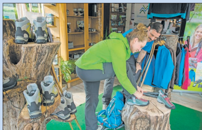
Vaude-Rucksäcke und weiteres hochwertiges Wanderequipment kann in den Best of Wandern-Testcentern im Dachstein Salzkammergut (o.), Donauebergland (li.) und im Naturpark Ammergauer Alpen kostenfrei für einen Tag ausgeliehen werden (alle Testcenter siehe Karte).