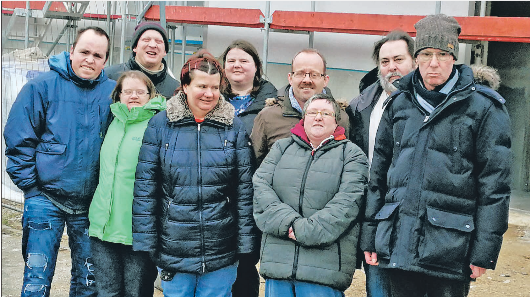
In freudiger Erwartung auf die Fertigstellung der neuen Unterkünfte: Die zukünftigen Bewohner des Lebenshilfehauses III.

D üren. Mit dem Bau und dem Bezug des Lebenshilfehauses I im Februar 2009 reagierte die Lebenshilfe Düren auf die veränderten Rahmenbedingungen „Ambulant vor Stationär“.