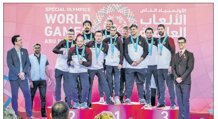
Freute sich über Silber: das Team der Unified-Basketballer aus Hagen.

Bei Special Olympics starten die Athleten in ihren Leistungsgruppen und erhalten dadurch alle die Chance auf gute Platzierungen und damit auf Anerkennung. Für die vielen großartigen Momente an Spannung und Emotionen steht u.a. das Spiel des Handball Unified Teams um Platz 3 gegen