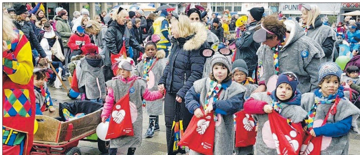
Die „Eschfeldmäuse“ hatten sichtlich viel Freude an ihrem Zug durch die Innenstadt.

Auch Kinder der Kindertagesstätten „Eschfeldmäuse“ und „Pustblume“ nahmen zum zweiten Mal am bunten Treiben im Kinderkarnevalszug teil. Die Kinder wurden durch viele ehrenamtliche Begleiter unterstützt. So war es schön, wie die Kinder voller Elan und Begeisterung den zahlreichen Zuschauern am Wegrand Kamelle zuwarfen. Trotz des trüben Wetters hatten alle Beteiligten großen Spaß. Vielen Dank an sämtliche Ehrenamtler, durch deren Hilfe diese Aktion möglich wurde.