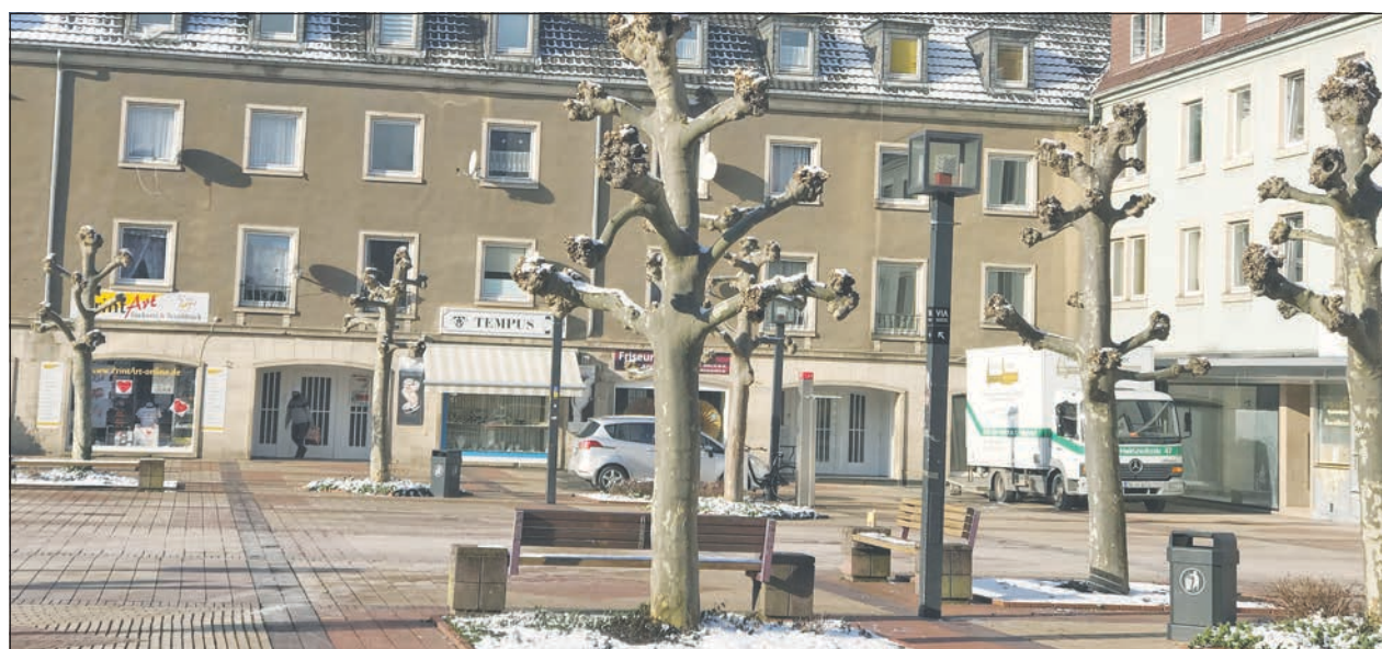
Marktplatz Jülich: Ladenlokal wird Anlaufstelle der Lebenshilfe im Kreis Düren