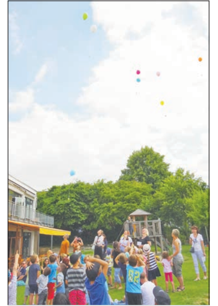
Luftballon-Aktion in der Kita

Das Deutsche Kinderhilfswerk hat Anfang Juli das große Engagement der Kita „Hürther Ströpp“ in Hürth bei Köln zur stärkeren Verankerung von Kinderrechten in der Kita bei einer kleinen Festveranstaltung gewürdigt. Anlässlich des einjährigen Projekts „bestimmt bunt – Vielfalt und Mitbestimmung in der Kita“ wurden die Mitarbeiter der Einrichtung zu den Themen Kinderrechte, Inklusion sowie Partizipation fortgebildet. Dabei erhielt die Kita neben einer fachlichen Be-