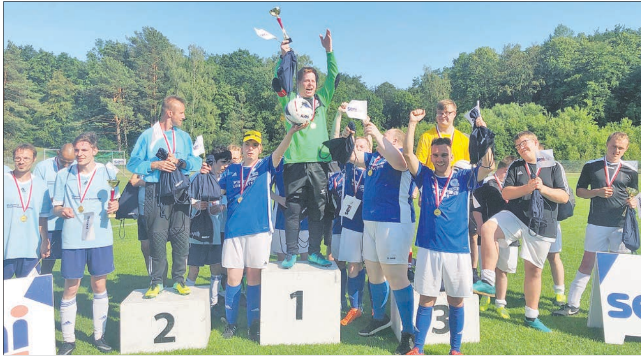
Jubeln über den Sieg in Gruppe 2 beim Seni-Cup: die „Mannschaft Inklusive“.

Von einem besonderen Fußballprojekt zu einer starken Mannschaft