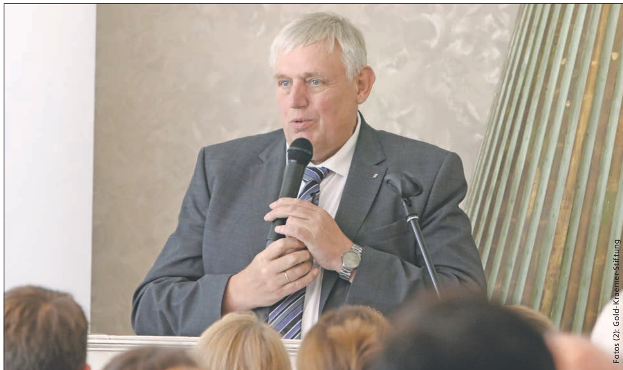
NRW-Gesundheits- und Sozialminister Karl-Josef Laumann sprach beim 10-jährigen Festakt des FIBS

NRW-Gesundheits- und Sozialminister Karl-Josef Laumann beim Festakt zum 10-jährigen Bestehen des Forschungsinstituts für Inklusion durch Bewegung und Sport (FIBS) in Frechen