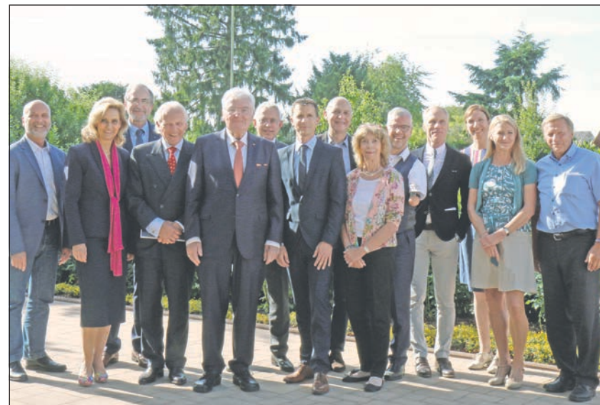
Dabei waren namenhafte Persönlichkeiten aus Wissenschaft, Wohlfahrt, der Gold-Kraemer-Stiftung, Politik und Verwaltung.

be am Arbeitsleben, Verbesserung der Mobilität oder Bewegung und Sport von Rollstuhlnutzern. Ein zentrales Anliegen sei es nun, so das Institut, in Zukunft den Sport über die einzelnen Fachinstitutionen hinaus neu zu organisieren. Vereine, Schulen, Einrichtungen der Eingliederungs- und Altenhilfe, der Arbeitsplatz sowie nachbarschaft-