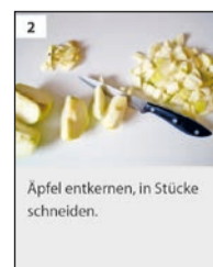
Apfel entkernen, in Stücke schneiden.