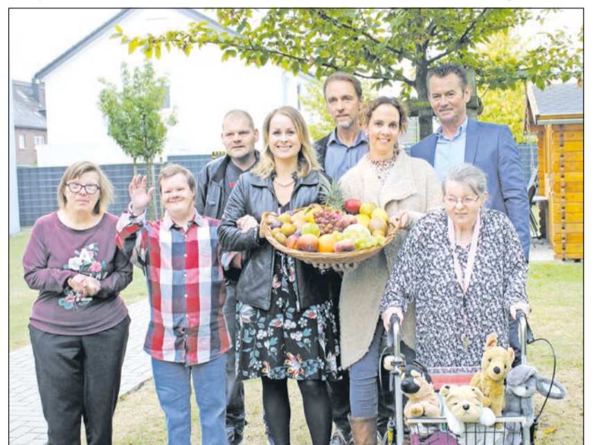
Gelungene Kooperation zwischen Fruchtimport Rosenland und der Lebenshilfe Mönchengladbach

bereits in der dritten Generation. Besonderen Wert wird auf die Qualität der Obst- und Gemüselieferungen gelegt, aber auch auf den persönlichen Kontakt zu Kunden und Lieferanten. Rosenland bezieht zwar auch frische Ware aus Süd- und Mitteleuropa, das Herzstück des Unternehmens liegt aber im Rheinland. Aus der guten Zu-