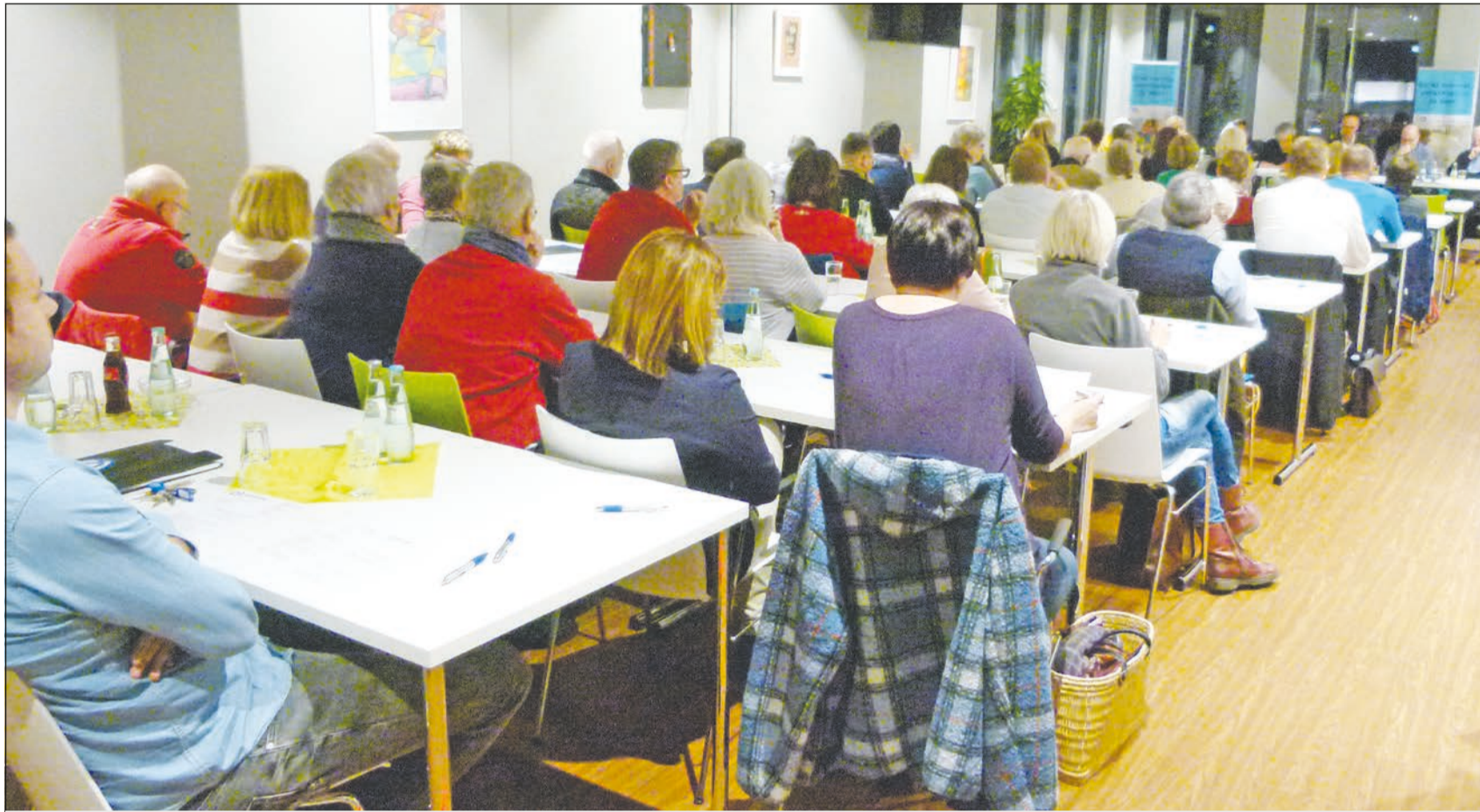
Der Vorstand freut sich über rege Teilnahme der Mitglieder.