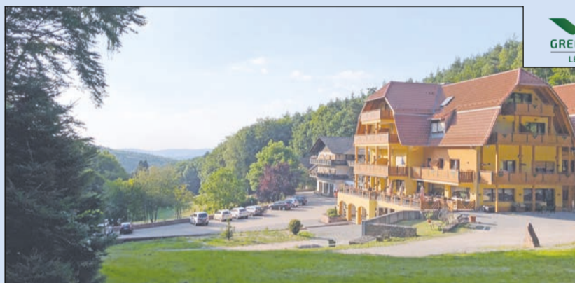
Drei Sterne Wald Hotel Heppe in wunderschöner Waldlage