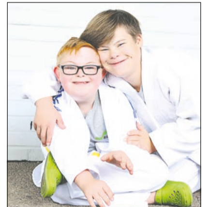
Bei Fotografin Jenny Klestil stehen die Menschen im Vordergrund und nicht das Handicap.

Menschen mit Down-Syndrom. Jenny Klestil: „Hierbei ist es mir wichtig zu zeigen, wie einfach der normale Umgang miteinander ist. Wie schön das Leben ist, wenn wir alle ein wenig von unserem Schubladendenken weg kommen.“ vw