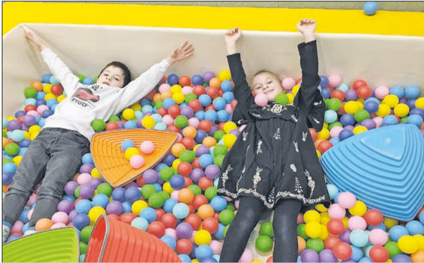
Bewegung und Spaß für Kinder

Kindertageseinrichtung Familienzentrum Schatzkiste wurde zum Bewegungskindergarten zertifiziert