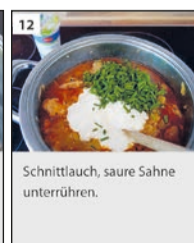
Schnittlauch, saure Sahne unterrühren.