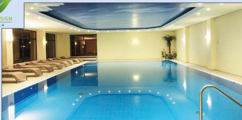
Großes, modernes Hotelhallenbad