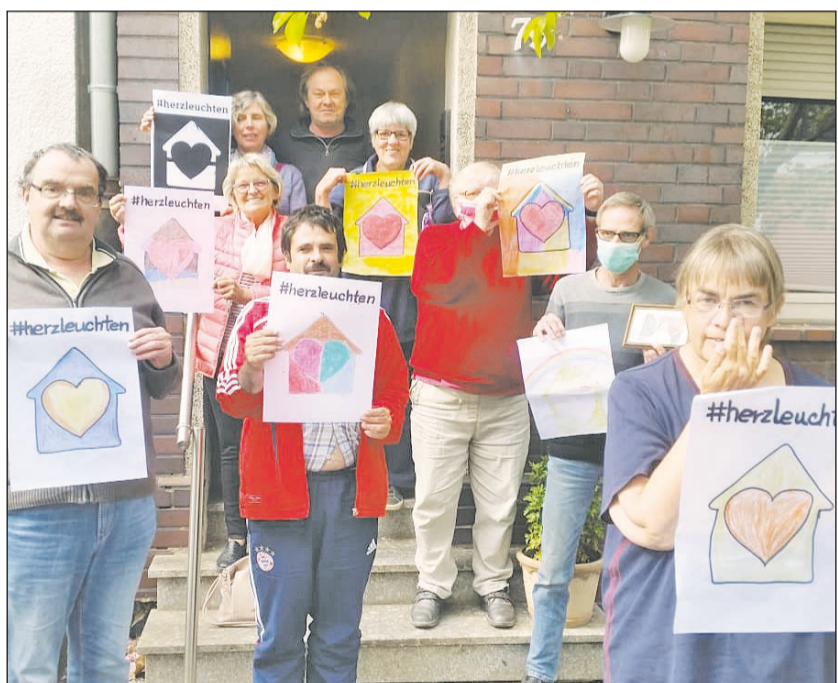
Unsere Künstler der Wohngruppe wollten und konnten etwas bewirken!

M it dem Bild von einem Herzen in einem Haus zeigt man, dass man wegen Corona zu Hause bleibt.