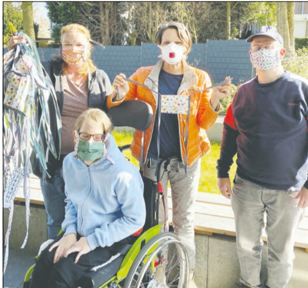
Helfende Hände und viel Unterstützung bei den Lebenshilfen Herne (o.li.), Wuppertal (o.re.), Kreis Viersen (u.li.) und Mönchengladbach (u.re.)