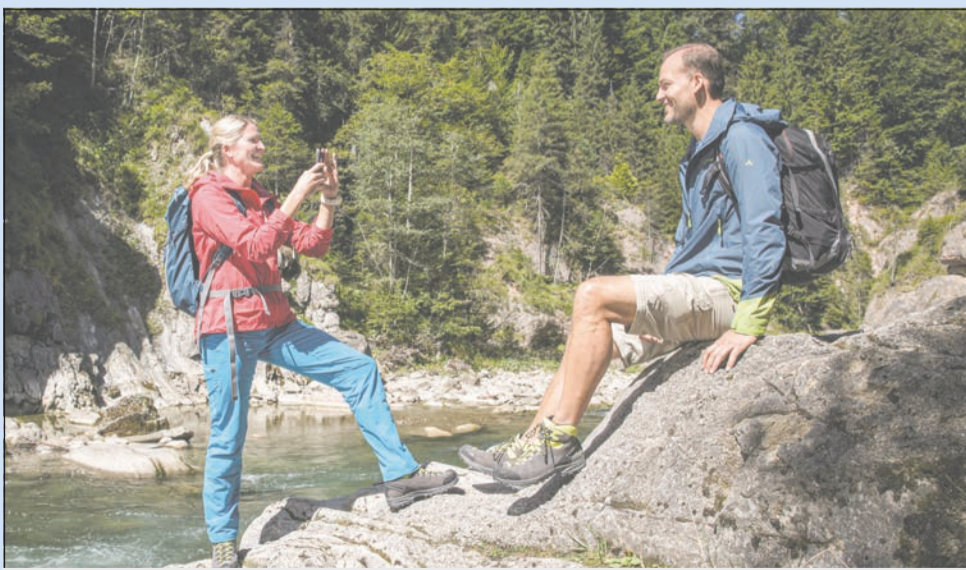
Mit viel Spaß in den BoW-Regionen unterwegs – ein Selfie als Nachweis genügt.