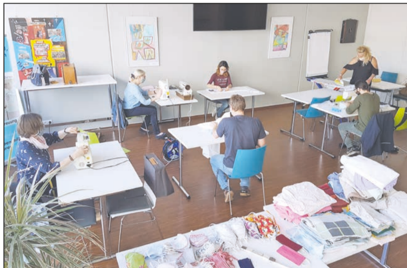
Im Einsatz miteinander füreinander! Es ist normal, verschieden zu sein! Deshalb gibt's verschiedene Ausführungen, Farben und Muster der Masken.