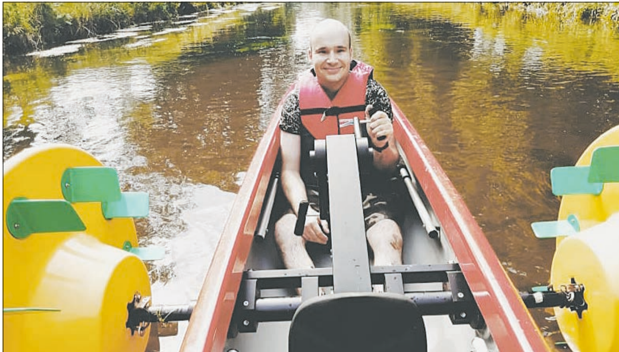
Hammans Freizeit hat ein tolles neues Boot im Programm.