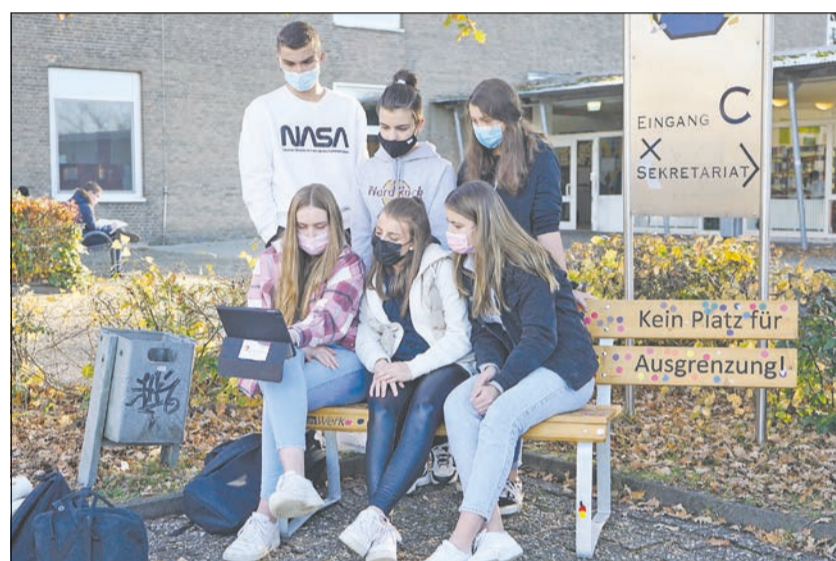
Schüler des Carolus-Magnus-Gymnasiums in Übach-Palenberg während der Videokonferenz mit einem inklusiven Team der Lebenshilfe Heinsberg

Ausgrenzung. Sie geben Einblicke in die vielfältigen kleinen und großen Welten der Region. Die Publikation wird voraussichtlich im Januar 2021 erscheinen. Außerdem ist eine Wanderausstellung mit Großfotos geplant. Ein Film über das Projekt ist auf youtube abrufbar: