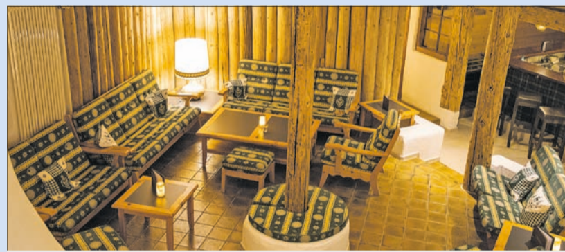
Gemütliche Atmosphäre: die Alpenlodge-Kaminbar

Gewinnen Sie zwei Übernachtungen für zwei Personen in der Juniorsuite inklusive Halbpension (Frühstück und Drei-Gänge-Menü-Dinner) in der Alpenlodge Val Gronda Obersaxen. Der Gutschein beinhaltet darüber hinaus einen Tag freien Eintritt in den Wellnessbereich, ein Begrüßungsgetränk am Anreisetag sowie einen kostenlosen Parkplatz. Der Gutschein hat einen Gesamtwert von ca. 640 Euro, je nach Saison.