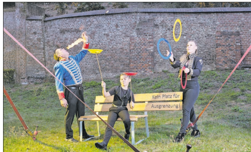
Zirkus Regenbogen: „Ausgrenzung zeigt Angst vor dem Fremden. Diese Reaktion erleben auch Familien wie wir, die berufsbedingt immer auf Reisen sind.“

ling, eine Kundin der Tafel, ein Bestatter und viele mehr werden in einem 60-seitigen Bildband vorgestellt und sind gleichzeitig mit einem kurzen Statement zum Thema vertreten. Die dort gesammelten Aussagen sind klare Bekenntnisse gegen Vorurteile, Ablehnung und