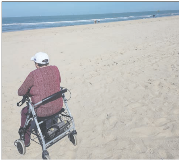
Sehnsucht nach Meer

wurde auch das Programm in ganz normaler Form geplant, mit der großen Hoffnung, bald wieder besseren Zeiten entgegensteuern zu können. So gibt es etwa zum Ende des Jahres 2021 Reisen jeweils in die Nachbarländer.