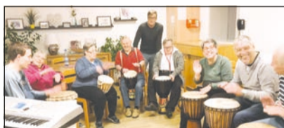
Unsere Trommelgruppe im Gerd-Bonn-Meuser-Haus

Zur Motivation der Abteilung gehören Anleitung und Unterstüt-