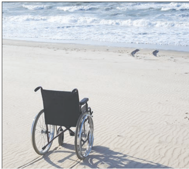
Im Sommer kommen wir wieder!

Die Freizeitabteilung der Lebenshilfe e.V. Düren ist zuversichtlich im nächsten Jahr wieder ein Stück weit Normalität in das Leben der Menschen mit Behinderung bringen zu können. Aus diesem Grund