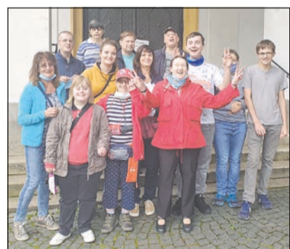
Unsere Bildungsreise nach München

In Planung ist ein Gesundheitskurs für Menschen mit Diabetes. Hierfür konnte ein erfahrener Ernährungs- und Sportlehrer gewonnen werden. Er erarbeitet mit den Krankenkassen ein Programm, das für Menschen mit Behinderung anwendbar ist und die Schwierigkeiten bei Ernährung und Bewegung