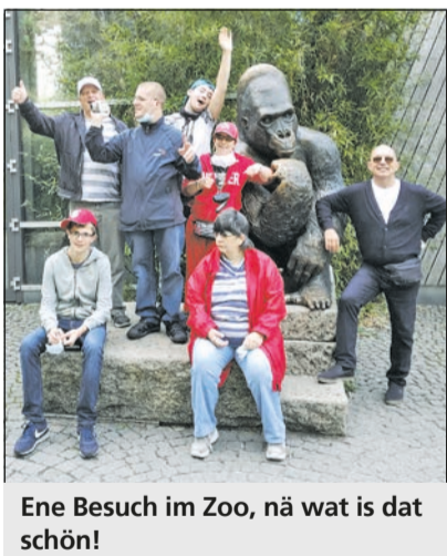
Ene Besuch im Zoo, nā wat is dat schön!

Alle Termine finden Sie im Programmheft, das unter https://lebenshilfe-dueren.de/ zum Download bereitsteht oder gerne in der Weiterbildungsabteilung bestellt oder abgeholt werden kann.