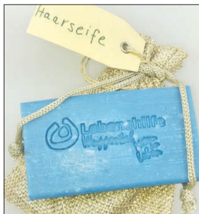
Die neue umweltfreundliche Haarseife der Lebenshilfe Wuppertal

ben. In der Seifenwerkstatt an der Heidestraße duftet es nach frischer Meeresbrise, wenn die Mitarbeiter die neue Haarseife der Lebenshilfe herstellen. Haare waschen ohne Shampoo aus Plastikflaschen – das steckt hinter der Idee der dezent duftenden Haarseife für Mann und Frau. Die 50-Gramm-Blockseife besteht aus 70 Prozent Oliven- und 30 Prozent Kokosöl. Außerdem hat das Produkt einen Conditioner inklusive und garantiert damit leichtes Kämmen. Verpackt in einem plastikfreien Jute-Beutel kostet die vegane Seife 3,60 Euro. al