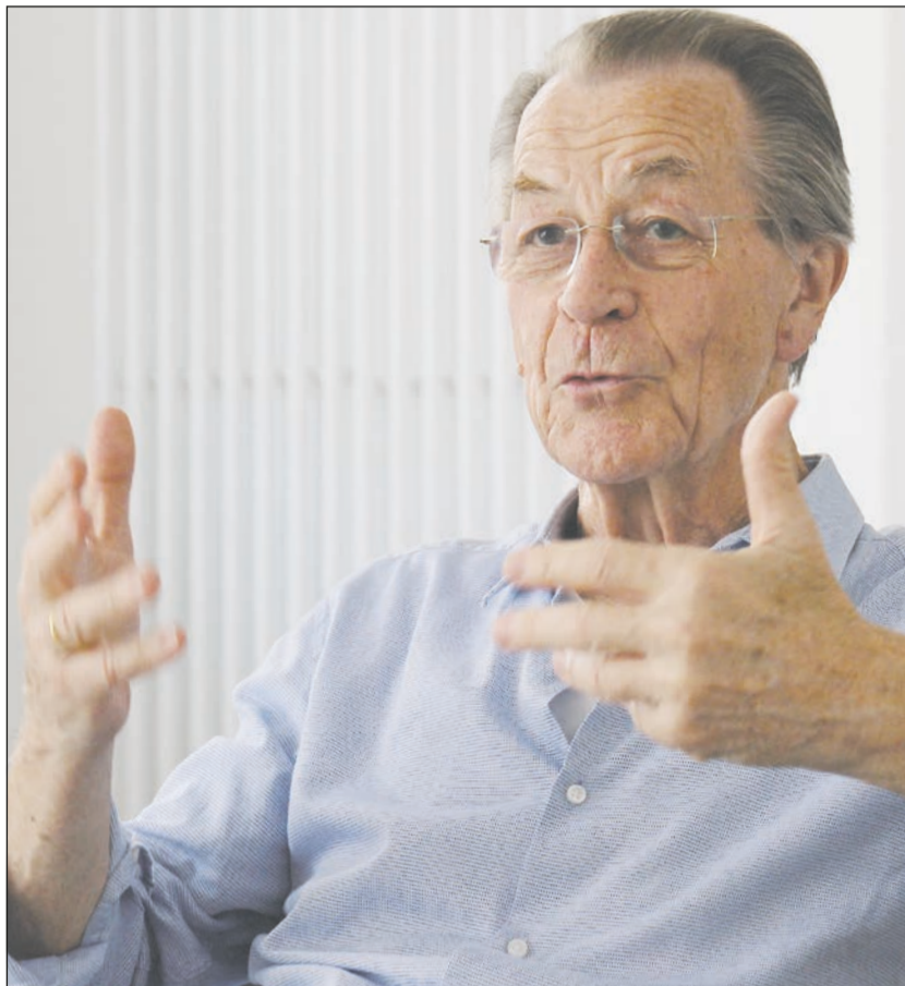
Gut drauf: der ehemalige Vizekanzler Franz Müntefering im Interview bei der Lebenshilfe Herne