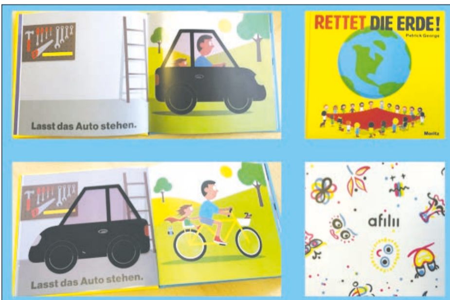
Der verdiente Gewinn für die „Pustebblume“