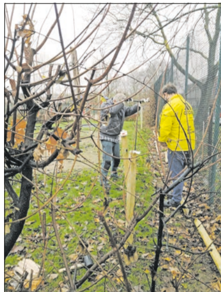
Starke Väter im Einsatz

Für die kleinen Baumeister bietet eine solche Hecke viele positive Elemente, die Kinder können ihrer Entwicklung entsprechend mithelfen. Also wird fleißig geschnitten, getragen, gezogen und aufgeschichtet. Die Kinder haben Spaß, auf der Hecke herum zu hüpfen, zur Verdichtung des Materials,