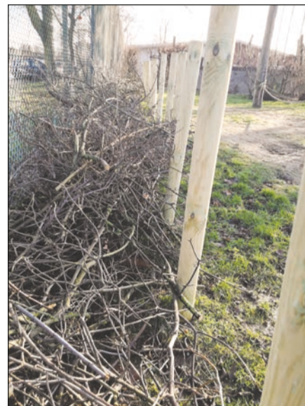
Die Hecke nimmt Gestalt an.