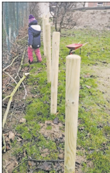
Das Stapeln der Äste beginnt.