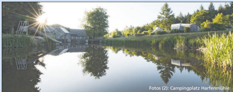
Idylle pur am See auf dem Campingplatz Harfenmühle

Gewinnen Sie einen Aufenthalt auf dem Fünf-Sterne-Campingplatz Harfenmühle: Vier Übernachtungen für die ganze Familie, gern inklusive Hund. Im Preis inbegriffen sind die Stellplatzgebühren für den eigenen Wohnwagen, Reisemobil oder Zelt sowie Strom. Exklusive sonstige Nebenkosten. Dazu gibt es eine geführte Wan-