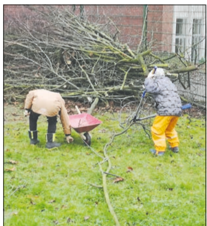
Die Kinder lernen auch den Umgang mit Werkzeugen.

und Zweige „einzuflechten“. Dabei wird sich untereinander ausgetauscht, wie man was am besten macht.