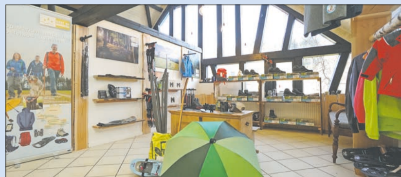
Neues Testcenter für Wanderer: Coole Ausrüstung kostenfrei ausleihen

Senden Sie uns eine E-Mail mit dem Betreff „Gewinnspiel Hunsrück Harfenmühle“ bis 27. Juli 2021 an gewinnspiel@lebenshilfe-nrw.de oder eine Karte/Brief per Post an Lebenshilfe NRW, Kennwort: „Gewinnspiel Hunsrück Harfenmühle“, Abtstraße 21, 50354 Hürth. vw