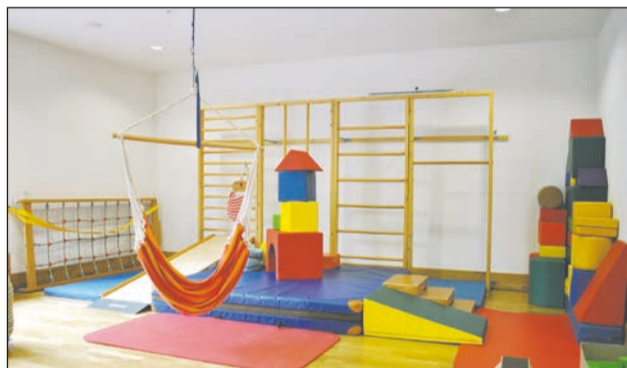
Die Stiftung haushaltet im Sinne der Betreuten der Lebenshilfe Düren und unterstützt die Einrichtungen bei Projekten und Anschaffungen.

Dafür werden wir uns im engen Schulterschluss einbringen, um mit der Geschäftsführung und dem Vereinsvorstand die so wertvolle Arbeit der Lebenshilfe e.V. mit ihren rund 400 Mitarbeiterinnen sowie Mitarbeitern zu unterstützen. Im Mittelpunkt stehen für unseren Stiftungsvorstand vor allem die