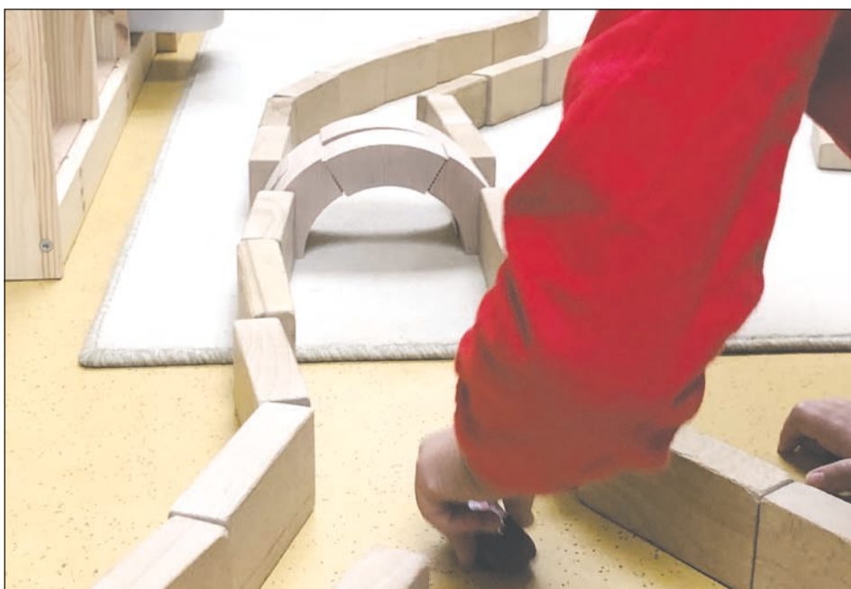
Nachhaltig Brücken bauen, die Welt verbinden und verbiegen.

Im Januar war es soweit, die „Pusteblume“ wurde von afilii reich beschenkt. Die international agierende Plattform bietet Material in kindgerechtem Design an, dass durch besonders kreatives und nachhalti-