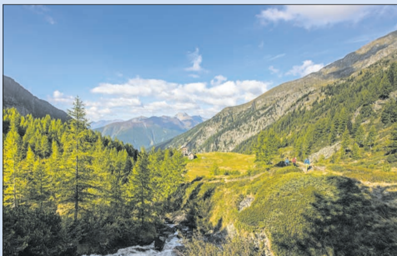
Unverfälschtes Naturerlebnis im Nationalpark

Gewinnen Sie zwei Übernachtungen für zwei Personen im Doppelzimmer inkl. Halbpension im Wert