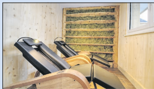
Wellness-Oase im Hotel Bergkristall

Wandergäste können im Best of Wandern-Testcenter im Besucherzentrum des Nationalparks in Mallnitz einen besonderen Service nutzen und Wanderausrüstung für einen Tag kostenfrei ausleihen und auf Tour testen. Alle Infos unter www.best-of-wandern.de