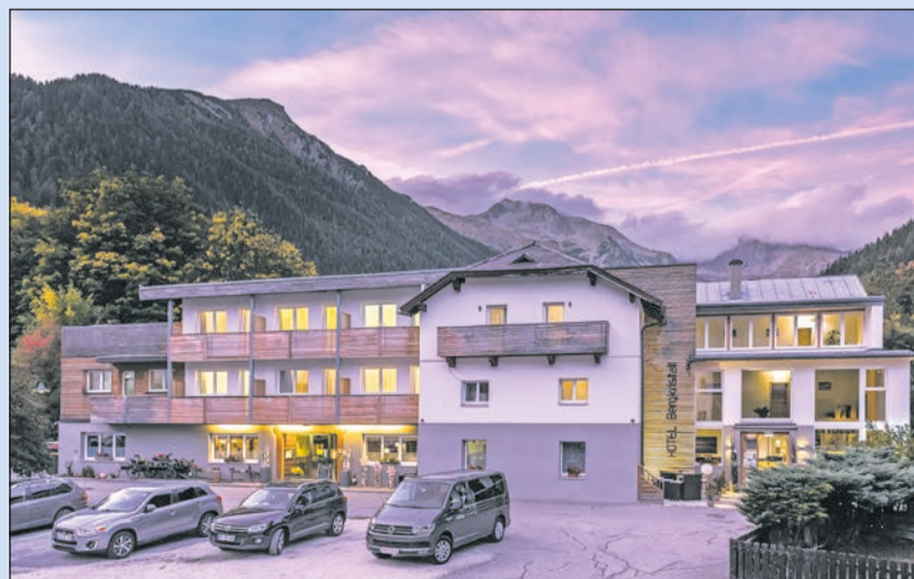
Das Hotel Bergkristall