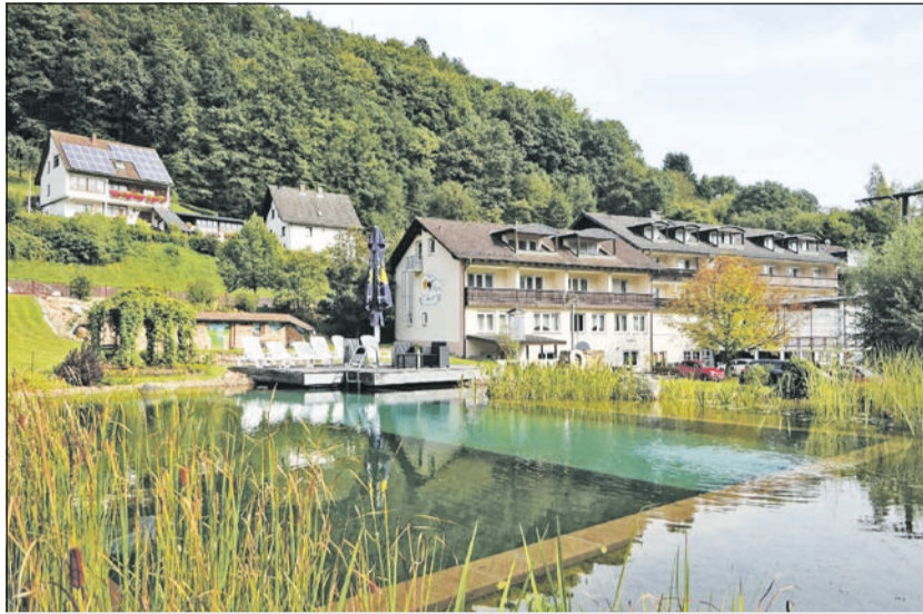
Drei-Sterne Hotel Christel im Herzen des Spessarts