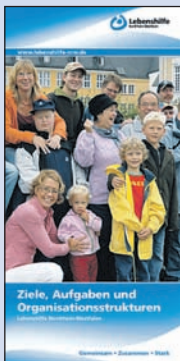
Ziele, Aufgaben und Organisationsstrukturen

Übernehmen Sie soziale Verantwortung. Unterstützen Sie die Ziele und Arbeit der örtlichen Orts- und Kreisvereinigungen der Lebenshilfe in NRW – werden Sie Mitglied. Bewegen Sie etwas durch Ihre Mitgliedschaft in der Lebenshilfe. Tragen Sie dazu bei, dass die Lebensqualität von Menschen mit Behinderung in der jeweiligen Region verbessert und ihre Teilhabe am gesellschaftlichen Miteinander gefördert wird.